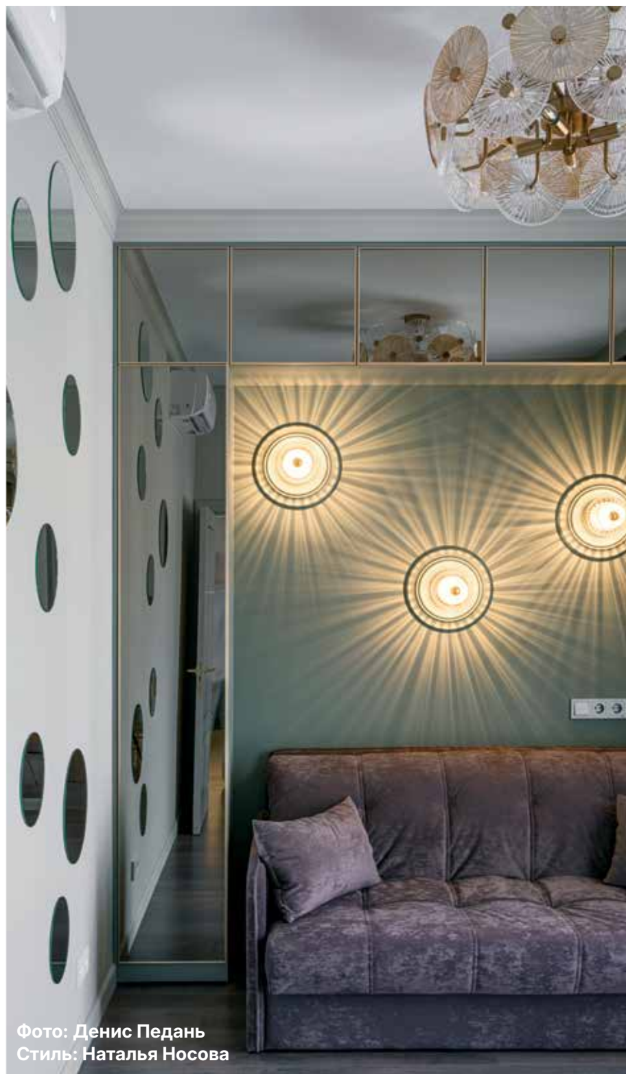
Стиль: Наталья Носова

«Постоянное стремление к совершенству – это важный принцип, которым я руководствуюсь»